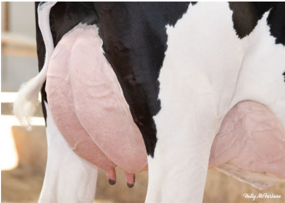
PROGENESIS GRAZIANO JAZMATIC