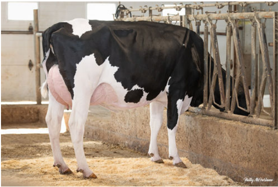
PROGENESIS GRAZIANO JAZMATIC